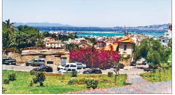
Tanca Limanı'ndan bir görünüş

İbn Abdülhakem, Fütûhu Mısr (Torrey), s. 199-205, 210, 217-218; Belâzürî, Fütûh (Rıdvân), s. 231-233; İbn Hurdâzbih, el-Mesâlik ve'l-memâlik , s. 88-89; Ebû Bekir el-Mâlikî, Riyâzû'n-nüfûs (nşr. Beşîr el-Bekkûş – Muhammed el-Arûsî el-Matvî), Beyrut 1403/1983, I, 46-47; Yâkût, Mu'cemü'l-büldân (Cündî), IV, 49; İbnü'l-Esir,