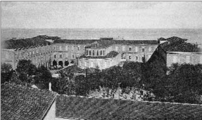
Beyrut'ta Saint Joseph Külliyesi