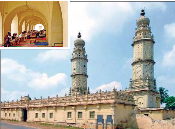
Srinangapatna'da Cami Mescid ve içinde Kur'an öğrenen öğrenciler - Karnataka / Hindistan

Hindistan ve Pakistan. Hz. Ömer zamanında başlayan, Emevîler döneminde kesin sonuç alınan Sind ve Hindistan fetihleri neticesinde İslâm eğitim ve ilim geleneği çok eski, köklü ve zengin bir kültüre sahip olan