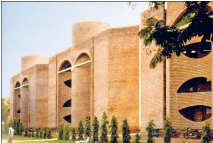
Ahmedâbâd Üniversitesi – Hindistan