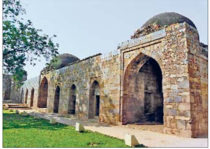
Hindistan'da Kutub Minâr Külliyesi içinde yer alan Alâeddin Medresesi – Delhi