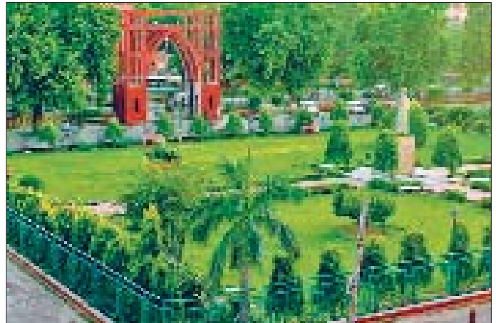
Câmia Milliyye Islâmîyye'nin bahçesi ve ana girişi - Yeni Delhi / Hindistan