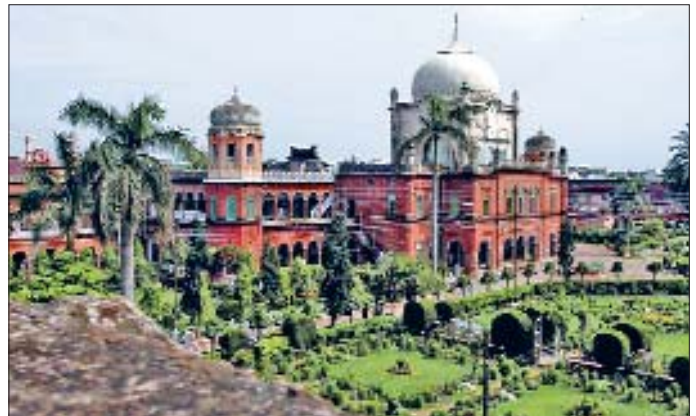
Diyûbend Dârülülûmü - Hindistan

İngilizler'in buradan çekilip bölgede Hindistan ve Pakistan adıyla iki devlet kurulunca her iki devlet özellikle İslâmî eğitim ve öğretim faaliyetlerindeki önceliklerini değiştirdi. Pakistan dinî eğitime yeni imkânlar sağlarken Hindistan zamanla eğitim kurumlarından desteğini çekerek İslâmî eğitimi geriletti. Nitekim açıldığı yıllarda en gelişmiş eğitim kurumlarından sayılan Dârülülûm-i Nedvetü'l-ulemâ Hindistan Devleti'nin teşekkülünden sonra oldukça sıkıntılı günler geçirdi. Sadece Hemderd Vakfı tarafından Hindistan'da ve Pakistan'da açılan çeşitli seviyelerdeki eğitim kurumları güçlü gelir kaynakları ve sivil yapıları saye-