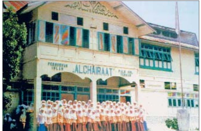
Endonezya'nın Sulavesi adasındaki Palu'da dini bir okul ve öğrencileri