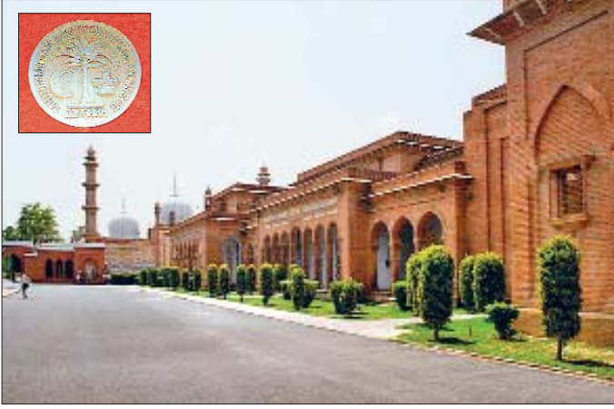
Hindistan'da İngiliz yönetimi zamanında kurulan Aligarh Üniversitesi ve kapısı üzerindeki arma

tirmalara gerek muhteva gerekse ürün bakımından önemli katkılar sağladı. Modern dönem Hint-İslâm tarihi yönünden tanınmış birçok ilim ve fikir adamı bu bölümde öğrenim gördü. Aloys Sprenger, müdürlük yaptığı dönemde (1844-1851) modern araştırma tekniklerinin hayata geçirilip ilmî standardın yükseltilmesine çalıştı. Kolej 1877'de Lahor'a intikal ettirildi ve Pencap Üniversitesi'nin nüvesini teşkil etti. Delhi Koleji 1917'de müslümanlarca kurulan Haydarâbâd Dekken'deki Osmâniye Üniversitesi ile Delhi'deki Câmia Milliye İslâmiyye'nin (1920) prototipi oldu. Aslında Câmia Milliye İslâmiyye, Şeyhülhind Mahmûd Hasan Diyûbendî'nin modern tarzdaki eğitimle geleneksel medrese sistemini birbirine yaklaştırma düşüncesinin ürünü olarak ve Aligarh Koleji'nin bu düşünceye yanaşmaması üzerine ortaya çıktı.