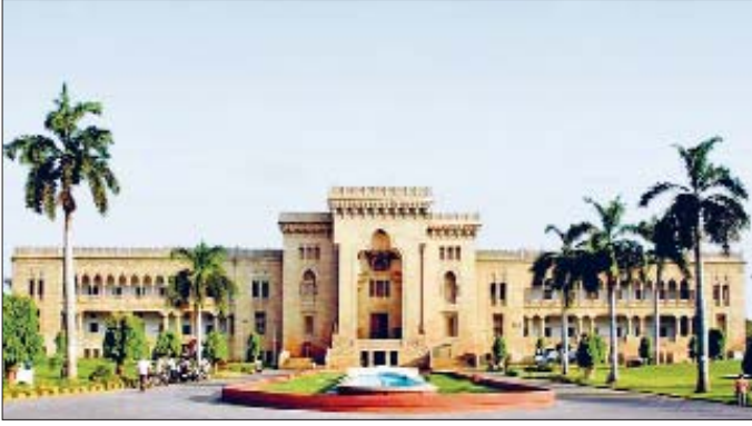
Haydarâbâd Dekken'de Osmâniye Üniversitesi Güzeli Sanatlar Fakültesi – Hindistan

sinde her türlü olumsuzluğa rağmen gelişme gösterdi. Büyük bir kısmı Hindistan'da kalan ilk önemli medreseler devletin genel tavrı ve Hindu çoğunluğun etkisiyle gerileme dönemine girdi ve bazıları kapandı. Ülkede demokrasinin yerleşmesi sayesinde bunlardan bir kısmı tekrar faaliyete başladı ve güçlendi. Müslümanlar tarafından bazı yeni eğitim kurumları açıldı. 1947-1971 yılları arasında Doğu ve Batı olarak varlığını sürdüren Pakistan'da eğitim ve öğretim faaliyetleri bütün çabalara rağmen istenen seviyeye ulaşamadı. Ülkede okuma yazma bilenlerin oranı 1990'larda % 25'e, 2006'da % 55-60'a çıkabilirdi. Bunların sadece % 5 veya 6'sı üniversite mezunudur (Shahzad, s. 336-337). Son yıllarda kadınların eğitimine daha fazla önem verilmekte, onlara yönelik eğitim veren üniversiteler ve kampüsler oluşturulmaktadır (bk. Anis Ahmad, tür.yer.).