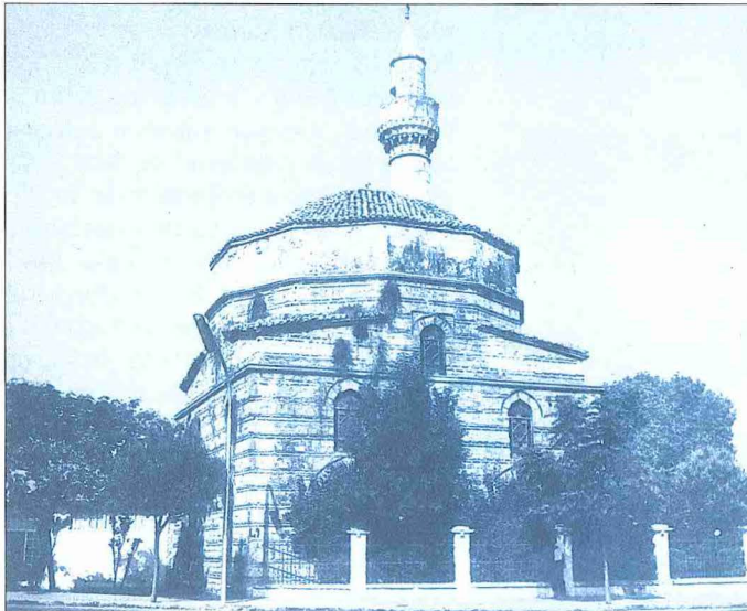
Avlonya'da Muradiye Camii diye anılan Sultan Süleyman Camii (949/1542-1543)

Osmanlı ordularının acı mağlûbiyete uğradığı Balkan Savaşı sırasında burası Arnavut milliyetçilerinin merkezi oldu. İsmâil Kemal Vlore'nin liderliğindeki Arnavut milliyetçileri, Avlonya'daki bir evin balkonundan bağımsızlıklarını ilân ettiler. Avlonya I. Dünya Savaşı'nın patlak vermesine kadar da Arnavutluk'un merkezi olarak kaldı. Savaşın sona İtalyanlar burayı Balkanlar'a yayılmak yolunda önemli bir hareket üssü olarak gördüler. Fakat İtalyan kuvvetleri Arnavut milisler tarafından geri püskürtüldü. Milletlerarası anlaşmalar Avlonya'