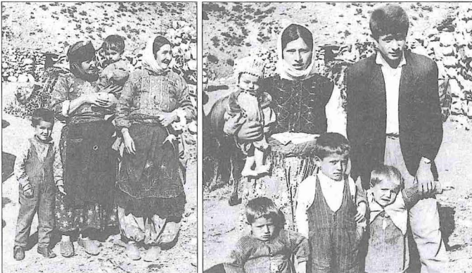
Bir Avşar ailesi ile Avşar kadınları - Pınarbaşı / Kayseri