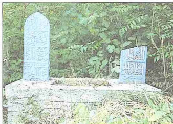
Mimar Ayas Ağa'nın Sarachanebaşı'ndaki eski ve Eyüp'e nakledildikten sonraki yeni kabri - İstanbul