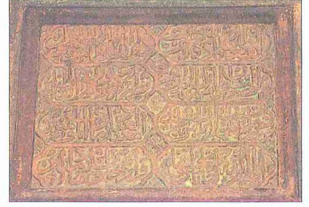
Ayas Paşa Camii inşa kitâbesi

ları zevkine işaret eder. Caminin orijinal güzelliğini koruyabilmiş tek aksama, değişik biçimli bir kemer içinde açılmış olan kapısıdır. Minare girişi de aynı üslûpta daha ufak biçimde yapılmıştır.