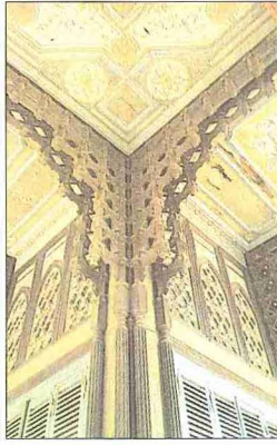
Ayasağa Kasrı'nın Çinili Köşk veya Av Kasrı adıyla tanınan Havuzbaşı Köşkü ve köşkün ahşap işçiliğinden bir detay