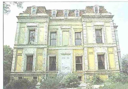
Ayasağa Kasrı ve kasrın içinden bir görünüş - Maslak / İstanbul

Çinili Köşk'ün bu adı almasının sebebi, duvarlarını kaplayan çeşitli renk ve desenlerdeki çinilerdir. Bunların istisnasız hepsi Avrupa'da yapılmış olup hiçbir bakımdan Türk çini sanatı geleneği ile bağlantılı değildir. Gerek dış revandanın gerek içerideki salonun tavanları da zengin biçimde nakışlarla bezenmiştir. Ayrıca panjurlu alt pencerelerin üstünde sıralanan tepelik pencereler de renkli camlarla kapatılmıştır. Kasrın etrafın-