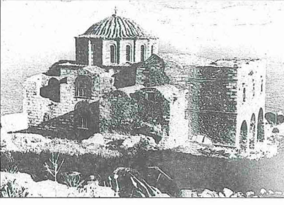
Mora yarımadasında Benefşe (Monembasia) Ayasofya Camii

bu ikinci Osmanlı devri de bir asır kadar sürmüştür. Türkler tarafından Benefşe (Menekşe) adıyla tanınan Monembasia'da XVII. yüzyılda Evliya Çelebi kale içinde iki cami gördüğünü bildirmektedir. Bunlardan biri Fethiye Camii olup Kanûnî Sultan Süleyman vakfı olarak kiliseden çevrilmiştir. Diğeri ise kale kapısının iç tarafında Derviş Mehmed Ağa (Paşa ?) adına yapılmış kiremit örtülü küçük bir cami veya mesciddir. Fethiye Camii, Monembasia Ayasofyası olarak tanınan yapıdır. Bu, Bizans sanatında "sekiz destekli tip"te büyükçe bir kilisedir. Cami olarak kullanıldığında güney tarafındaki yan duvarının ortasına bir mihrap nişi yapılmak suretiyle bina kible istikametine çevrilmişti. Mora Yunan ayaklanması (1821-1827) ile kaybedildikten sonra Ayasofya Camii de tekrar kiliseye çevrilmiştir.