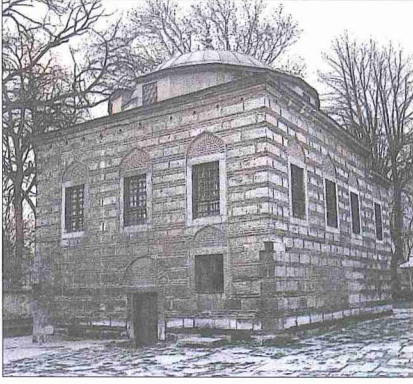
Ayasofya Sıbyan Mektebi

da pencereleri olan bir kubbe ile örtüldür. Merdivene komşu olan duvarda ise bir ocak bulunmaktadır.