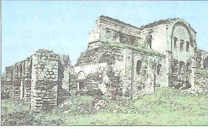
Ayasofya Camii - Enez / Edirne

veyete göre Balkan Harbi'nde minaresi de yıkılmıştır. Birkaç defa tamiri için teşebbüslerde bulunulduğu ve keşfi yapıldığı halde 1962'deki ziyaretimizde tehlikeyi önleyici hiçbir tedbir alınmamış olmasına rağmen Enez'deki tek cami olduğundan ibadete açık bulunuyordu. Fakat tarihî yapı birkaç yıl sonra tamamen çökmüştür. Bugün duvarlarının bir kısmı ayakta olmakla birlikte mimari özelliklerini kaybetmiş bir yıkıntı halindedir.