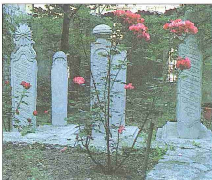
Aydınolu Tekkesi'nin hazîresi

Kurucusu, Germiyanoğulları ordusunda subaşı olan Mübârezeddin Gazi Mehmed Bey'dir. Mehmed Bey önce, Aydın ili topraklarında fethe girişen Mentеше beyinin damadı Sasa Bey'e yardım etti, ancak daha sonra bu bölgeleri ondan alarak Aydın - ili'ne hâkim oldu (1308). Bundan sonra fetihlere girişen Mehmed Bey İzmir'in müslüman kesimi ile Ayasuluk (Selçuk), Tire, Sultanhisarı ve Bodemya'yı da ele geçirdi. Bu şekilde geniş topraklara sahip olan Mehmed Bey idaresi altındaki yerleri beş oğlu arasında paylaştırdı ve kendisi en küçük oğlu ile birlikte Birgi'ye yerleşti. Bu arada Ayasuluk'ta bir donanma meydana getirdi. Bu donanma ile 1319'da Sakız adasına bir baskın yaptıktan başka, iki buçuk yıllık bir kuşatmadan sonra Sakız hâkimi Cenovalı Martino Zaccaria idaresindeki İzmir Limanı'nı ele geçirdi (1328 veya 1329). Bu arada, Sakız'a yeniden hâkim olan Bizans İmparatoru III. Andronikos Türkler'e karşı yakınlaşma siyaseti takip ederek Aydın ve Saruhanlıları birer antlaşma yaptı. Buna rağmen İzmir beyi olan Umur Bey babasını tasvip etmeyerek Sakız, Bozcaada, Semadirek adalarıyla Gümölcüne yöresi, Mora sahilleri ve Gelibolu bölgesine akınlarda bulundu. Bu sırada Nak-