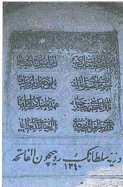
Ayrılık Çeşmesi ve çeşmenin 1154 (1741) ve 1340 (1921-22) tarihlerine ait tamir kitâbeleri - Kadıköy / İstanbul