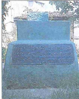
Baba Haydar Camii ve caminin hazîresinde bulunan Baba Haydar'ın mezarının kitâbesi - Eyüp / İstanbul