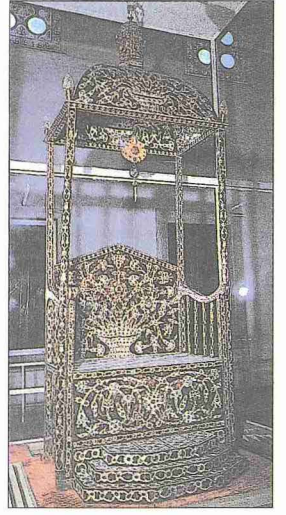
I. Ahmed'in bağa ve sedef kakmalı tahtı (Topkapı Sarayı Müzesi, Envanter, nr. 1652)

En makbul bağa, deniz kaplumbağalarının eretmochelys imbricata türünün kabuklarından elde edilir. 50-90 cm. arasında boyları olan bu kaplumbağalar en fazla Güney Pasifik ve Karayip denizlerinde bulunur. En güzel renklere sahip ve