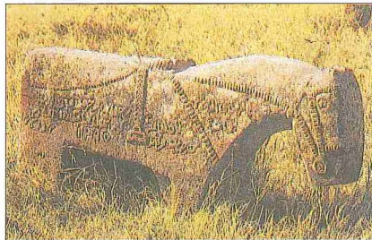
At şeklinde mezar taşı - Karabağ / Azerbaycan