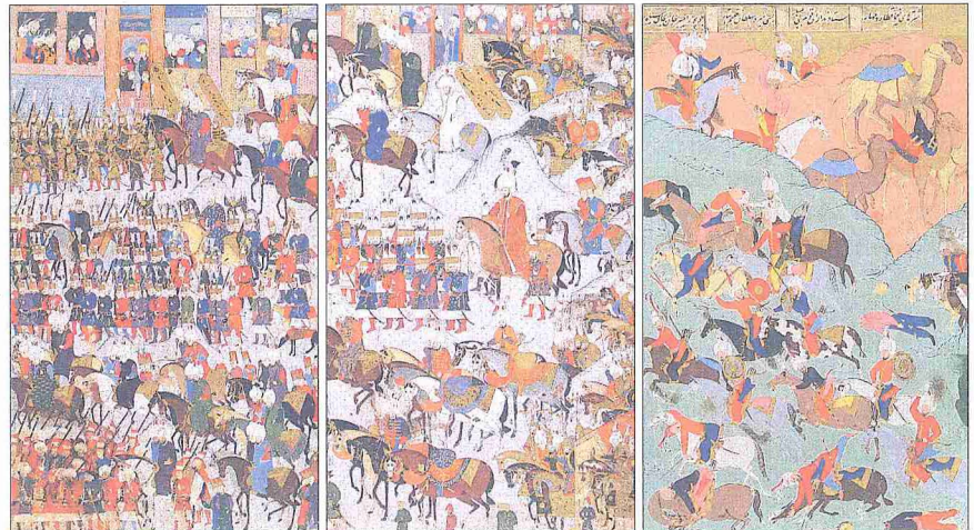
Atları bir merasim sırasında ve savaş alanında gösteren minyatürler (İÜ Ktp., FY, nr. 1404 vr. 38 b , 39 a , 85 b )

Kaynaklarda, Memlûkler'de de ordunun büyük kısmının atlı askerlerden meydana geldiği ifade edilmektedir. Meselâ Sultan Berkuk devrinde sadece Gazze'den Diyarbakir'e kadar olan saha içinde yerleşmiş bulunan Bozok, Dulkadirli, İnaoğlu, Ramazanoğlu, Avsar, Döğer, Harbendeli, Ağaçeri, Varsak, Kınık, Bekirli, Bayındır, Bayat gibi Türkmen boy ve ulusları 180.000 atlı çıkarmaktaydılar. Kalkaşendî'nin belirttiğine göre Mem-