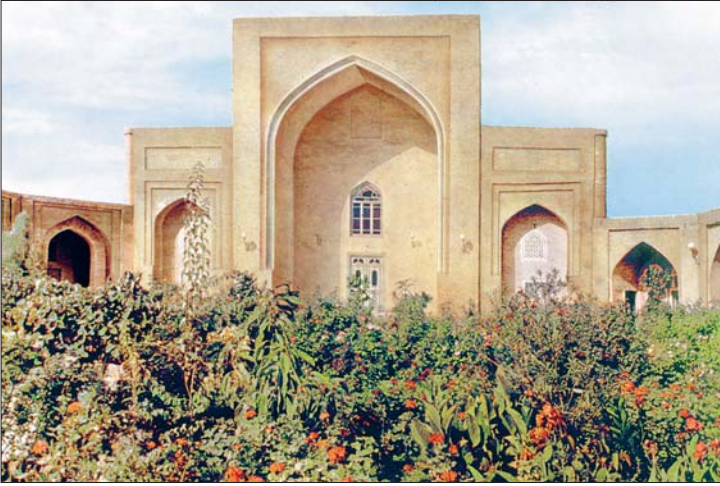
Barak Han Medresesi – Taşkent / Özbekistan

hir önce bu hanlığın idaresine, ardından onların yerine bölgeye hâkim olan Timur'un ve haleflerinin idaresine girdi; 1410'da Mirza Uluğbey'e mülk şeklinde verildi. Bu yıllarda şehir genişledi; ziraat, zanaat, ticaret ve mimari açıdan gelişti.