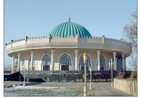
Emir Timur Müzesi – Taşkent / Özbekistan

Taşkent, VIII. yüzyıl başlarında Emevîler'in Horasan valisi Kuteybe b. Müslim tarafından ele geçirilip (94/713) tahrip edildi (Taberî, VI, 484). Mahallî Türk hükümdarlarının yönettiği şehir bir süre sonra Çinliler'in hâkimiyeti altına girdi. 133'te (751) Çin Valisi Kau Seinçi, Şâş'ın Türk hükümdarını öldürdü. Hükümdarın oğlu Araplar'dan yardım isteyince Ebû Müslim-i Horasânî, Ziyâd b. Sâlih'i bölgeye gönderdi. Zilhicce 133 (Temmuz 751) tarihinde Talas nehri kenarında yapılan savaşta Türkler