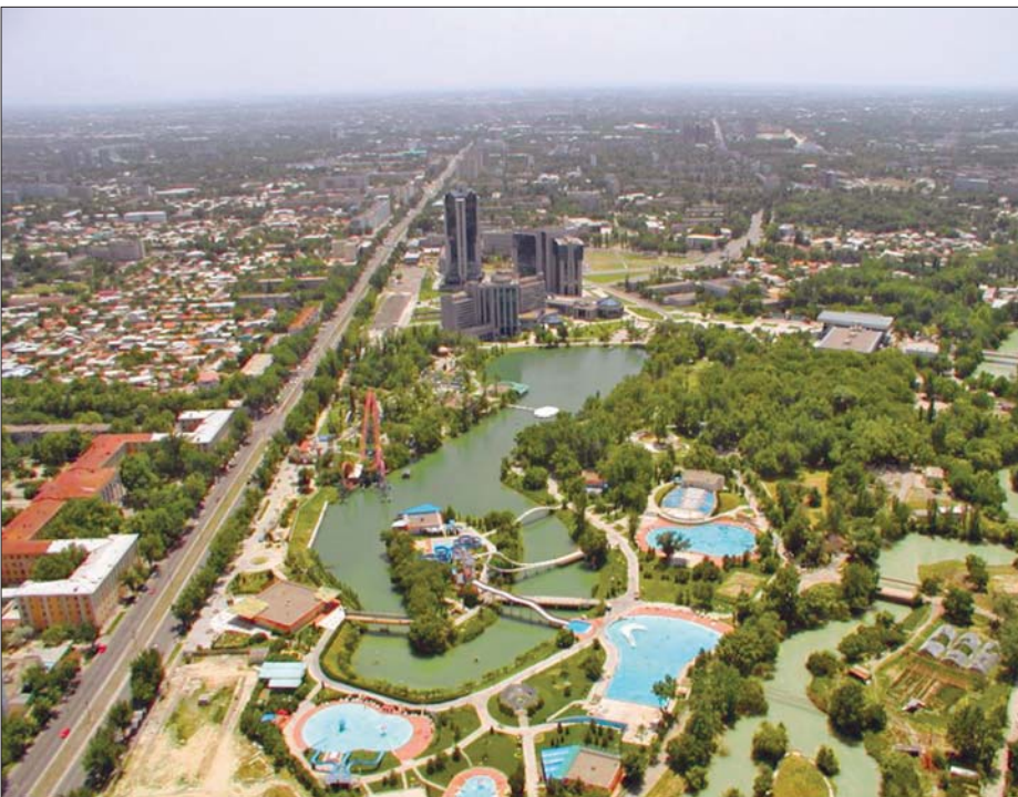
Modern Taşkent'ten bir görünüşü

IV. (X.) yüzyılın sonlarında Karahanlı Hükümdarı Ebû'l-Hasan Ali Arslan Han'ın Sâmânîler'in Horasan valisi Ebû Ali Simcürî ile yaptığı anlaşmaya göre Sâmânî toprakları Ceyhun nehri sınır kabul edilerek paylaşılınca Taşkent Karahanlı hâkimiyetine girmiş oldu. VII. (XIII.) yüzyılın başlarında Hârizmşahlar'ın eline geçen şehir 1220'de Cengiz Han tarafından istilâ edildi. Moğol hâkimiyeti devrinde burada basılan paralarda Taşkent adının kullanıldığı görülmektedir. Çağatay Hanlığı'nın Mâverâünnehir bölgesinde hâkimiyet kurmasıyla şe-