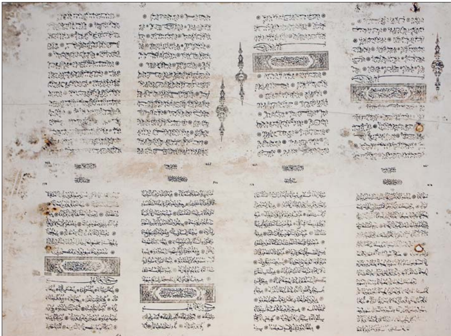
II. Abdülhamid döneminde fotolitografya (aks-i ziyâ) tekniğiyle hazırlanan taş basması kalıplarından biri