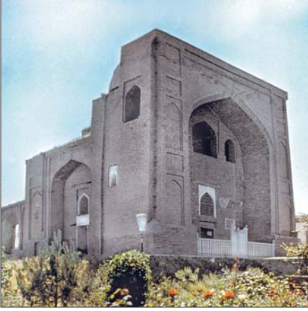
Kaffâl eş-Şâfi Türbesi – Taşkent / Özbekistan

2000. kuruluş yıldönümü kutlandı. Barış yılı etkinliklerine aktif biçimde katıldığı için 1989'da Birleşmiş Milletler kararıyla şehir barış elçisi fahri unvanı verildi. Taşkent 31 Ağustos 1991'de kurulan bağımsız Özbekistan Cumhuriyeti'nin başşehri oldu.