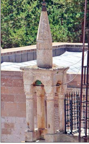
Taşkın Paşa Camii'nin minaresi

lemeli başlıklara sahip sütunçelerle sınırlandırılan taçkapının geometrik düzenlemeli ve rûmî-palmet süslemeli üç bordürü dikdörtgen çerçeveyi meydana getirmektedir. İki yanda bitkisel süslemeli başlıkları olan ikişer sütunçenin kullanıldığı kapı nişi yine kademeli sivri kemerle çevrelenmektedir. Sivri kemer üzerinde kaydırılmış yarım daire formlarında oluşan düzenleme görülmektedir. Üzeri geçme motifli bezenmiş basık kemerli kapı açıklığı niş içinde bulunmaktadır. Kemerin köşeliklerinde kabaralar ve bitkisel süsleme, üzerinde rölyef şeklinde oldukça taşkın bir bitkisel süsleme ve ışınsal bir düzenlemeye yer verilmiştir. Sivri kemerin üzerindeki bölüm de tamamen bitkisel süslemeyle kaplı olup bunun üzerindeki hafif dışa taşkın dikdörtgen bölümde bir pencere açıklığı vardır. Pencerenin yanlarındaki alanlar da bitkisel süslemeyle bezenmiştir ve üst iki köşesinde birer kabara mevcuttur. Günümüzde restore edilmiş olan yapı halk kütüphanesi olarak kullanılmaktadır.