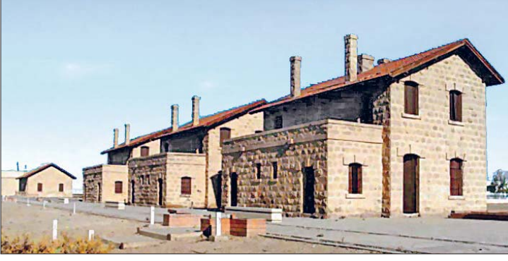
Hicaz Demiryolu hattı üzerinde yer alan Tebük İstasyonu

Birçok defa tamir edilen camiyi 1973'te Suudi Arabistan Kralı Faysal b. Abdülaziz yeniden inşa ettirdi.