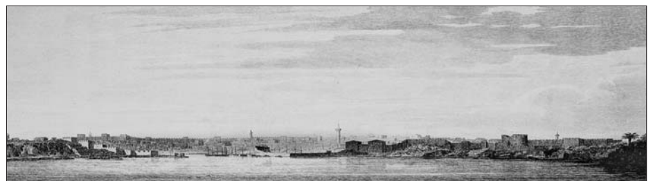
Antalya'nın XIX. yüzyıl başlarında çizilen bir gravürü (Fr. Beaufort, Karamanya , s. 124)

Osmanlı idaresi altında Teke sancağında nüfusun büyük çoğunluğu kır kesiminde yaşıyordu ve şehirleşme oranı oldukça düşüktü. XVI. yüzyılda Antalya, Elmalı, İstanoz ve Karahisararteke şehir, Kaş ve Kalkanlı ise kasaba yerleşimleri şeklinde dönemin resmî kayıtlarına girdi. Elmalı dışındaki şehirlerin kendi adlarıyla anılan birer kalesi vardı. 1530'da yaklaşık 5500 kişiyle sancak nüfusunun ancak % 5'ini barındıran bu şehirlerdeki mahallelerin tamamı yakını yirmi hânenin altında nüfus yoğunluğuna sahipti. 1568 yılında yirmi üç mahalleli Elmalı'nın on sekiz mahallesindeki nüfus yoğunluğu on hâneyi geçmiyordu. Sancağın en önemli şehri ve sancak merkezi Antalya'dır. Diğer önemli bir şehri, Antalya'nın batısında yer alan Elmalı da bir dönem sancak merkezliği yaptı. Burası Şahkulu isyanında İstanoz'la birlik-