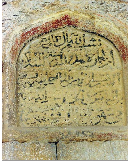
Korkutelî'nde Emir Sinâneddin Medresesi'nin kitâbesi

İbn Fazlullah el-Ömerî, Hamid-ili'nden bahsederken Dünder Bey'in kardeşi Yûnus'u Antalya hâkimi diye zikretmektedir. Kalkaşendî de Dünder'in bu memleketin beyi, kardeşi Yûnus'un Antalya emiri olduğunu yazmıştır. Ebü'l-Fidâ'nın İbn Havkal'den naklen verdiği bilgiye göre ise Antalya'yı zapteden kişi Sâbit b. Hamid'dir. İsmail Hakkı Uzunçarşılı'ya göre Ebü'l-Fidâ'nın Antalya fâtihi diye gösterdiği Sâbit