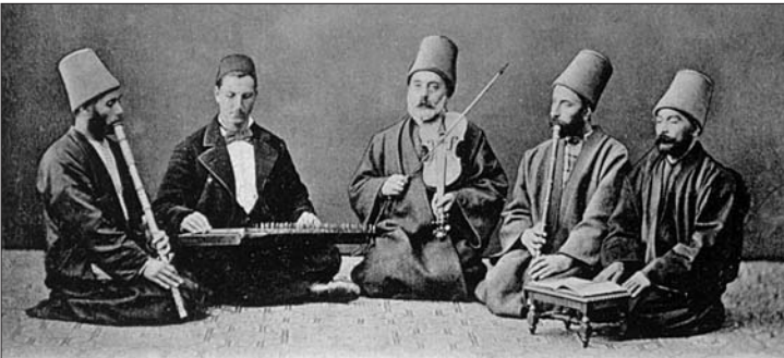
Bir mevlevî âyininde mutrip heyeti

Bir mûsiki tarzı olarak ele alınıp gelişmesi daha çok Osmanlı kültür ve medeniyeti çerçevesinde şekillenen Türk dinî mûsikisi cami ve tekke mûsikisi diye iki bölümde incelenmiştir. Son zamanlarda "tasavvuf mûsikisi" olarak da ifade edilen tekke mûsikisi, "cehrî zikir yapan tarikatların zikirleri esnasında daha çok ritme dayalı, bazan bir veya birkaç enstrümanın iştirakiyle ortaya çıkan mûsiki" şeklinde tarif edilebilir. Tekke mûsikisi formları genelde Mevlevî âyini, ilâhî, mersiye, durak, şugul, nefes biçiminde sıralanabilirse de dinî mûsikide cami ve tekke mûsikisi sınıflandırılması çerçevesinde her iki bölümde yer alan formların kesin sınırlarla ayrılmadığını, bazı formlarının iki mûsiki şubesinde de ortak icra edildiğini belirtmek gerekir. Bu durumda her ne kadar tekkedeki ağırlığı daha fazla ise de ayrıca camide icra edilen ilâhî formu başta olmak üzere mevlid, mi'râciyye, na't, kaside, tevşih ve mersiye gibi formlar hem camide hem tekkede kullanılmıştır. Meselâ tekkelerde zikir esnasında zâkirler tarafından okunan zikir ilâhisi veya usul ilâhileriyle zikir dışında topluca okunan cumhur ilâhilerinin yanı sıra camide teravih namazı sırasında okunan ramazan ilâhileri, muharrem ayında hem tekkelerde hem camilerde okunan mersiyeler bu ortak icralardan bazılarıdır.