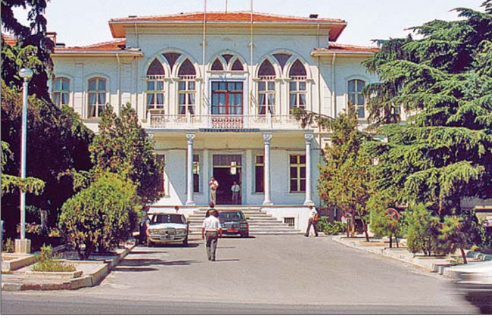
Tekirdağ Hükümet Konağı

rumda bulunuyordu. 1831'de yapılan ilk nüfus sayımına göre Tekirdağ ve İncecik'in nüfusu 19-20.000 kişi civarındaydı. Ruslar 1878'de ikinci defa Tekirdağ'a girdiler. Türk nüfusun bir kısmı şehri terketti. Şehir ancak XIX. yüzyılın sonlarına doğru tekrar gelişme gösterdi. 1880'e doğru 20.000 olan nüfusu 1890'larda 12.000'i müslüman 23.000'e ulaştı. Rumeli demiryolunun tamamlanmasıyla Tekirdağ Limanı yavaş yavaş işlevini yitirmeye başladı, fakat İstanbul ile Tekirdağ arasında haftada iki gün vapur seferleri devam etti. XX. yüzyılın başlarında 14.000 Türk, 19.000 Rum, 7600 Ermeni'nin ve az sayıda yahudinin bulunduğu kaydedilir. Bu sırada yine bağcılık en başta gelen ziraî faaliyeti oluşturuyordu. İskelesi de yeni bir canlılık kazanmıştı. Fakat Balkan savaşları şehirde tekrar ciddi bir sarsıntıya yol açtı. 1912'de Bulgarlar Tekirdağ'a girdi ve şehir ancak sekiz ay sonra geri alınabildi. I. Dünya Savaşı'nda Çanakkale savaşları sırasında iskelesi hayli faal bir askerî hareketliliğe sahne oldu. Mondros Mütarekesi'nin ardından müttefik güçlerce işgal edildi. Trakya'nın Yunanistan'a verildiği Sevr Antlaşması yapılmadan önce Yunanlılar 20 Haziran 1920'de Tekirdağ'a girdiler. Millî Mücadele'den sonra Mudanya Mütarekesi'yle şehir boşaltılarak Türkler'e iade edildi (13 Kasım 1922). Yunanlılar'ın çekilmesi sırasında şehrin Rum ve Ermeni ahalisi burayı terketti; onların yeri Yunanistan'dan gelen Türkler'le dolduruldu.