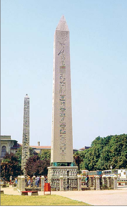
İstanbul Sultanahmet Meydanı'ndaki (Atmeydanı) dikili taş

bir kısım taşlar yarılıp aralarından su çıkmakta ve bir kısım taşlar Allah korkusuyla yukarıdan aşağıya düşmektedir (el-Bakara 2/74). Kur'an'da ayrıca gösteriş için sadaka verenler ve onu başa kakmak suretiyle sevabını yok edenler üzerinde az bir toprak bulunan kayaya (safvân) benzetilir ki şiddetli bir yağmur toprağın kaymasına yol açar ve onu çıplak bir taş (sald) halinde bırakır (el-Bakara 2/264). Yine Kur'an'da "tîn"den (küpçü toprağı) pişirilerek elde edilen "sicci" taşlardan, özellikle günahları yüzünden cezalandırılan Lût kavminin üstüne bu tür taşların yağdırıldığından (Hûd 11/82; el-Hicr 15/74; ez-Zâriyât 51/33) ve Kâbe'yi yıkmaya gelen Habeş ordusunun üzerine sürüler halindeki kuşlar tarafından bu taşların atıldığından (el-Fîl 105/4), inci ve mercandan, kıymetli taşlarla yapılmış süs eşyasından (en-Nahl 16/14; el-Fâtır 35/12; er-Rahmân 55/22) ve cennet kadınlarının yakut ve mercana benzediğinden (er-Rahmân 55/58) söz edilir. Kur'an'ın bildirdiğine göre cehennemden biri de taştır (el-Bakara 2/24; et-Tahrîm 66/6). Ashâb-ı Kehf'in hikâyesinde geçen "rakim" de bir yorumla göre onların adlarının üzerine yazıldığı taş kitâbedir.