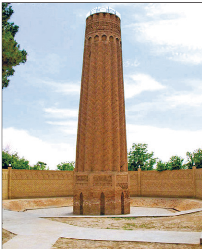
Çar Kurgan Minaresi – Tirmiz / Özbekistan

810 (1407) yılında Timur'un torunu Halil Sultan, Şâhruh'la mücadele sürecinde Tirmiz'i tahkim ettirdi. XVI. yüzyılda Tirmiz, Özbek hanlarının (Şeybânîler) eline geçti. 1646'da Bâbürlüler tarafından işgal