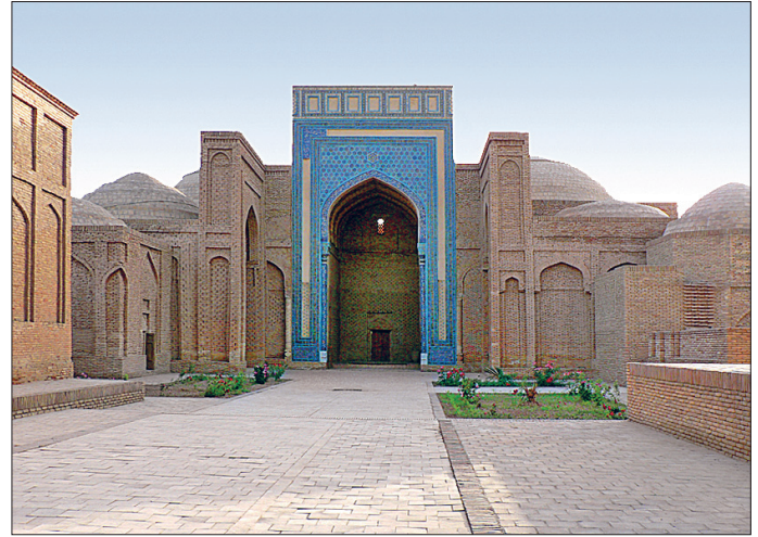
Sultân-ı Sâdât Külliyesi – Tirmiz / Özbekistan

edildi. 1758'de Mangıtlar'dan Atalık Muhammed Rahîm Han şehri yeniden inşa ettiyse de daha sonra şehir ve çevresi iç savaşlar yüzünden büyük tahribata uğradı. XIX. yüzyılın sonlarında Pattahisar ve Sâlihâbâd köyleri dışında her taraf harabe halindeydi. 1863'ten itibaren Türkistan ülkesi Çarlık Rusyası tarafından işgal edilince Rus askerleri 1894 yılında eski Tirmiz harabelerinden 8 km. uzaklıkta bir sınır kalesi (Toprakkorgan) kurdular. Şimdiki Tirmiz, Toprakkorgan çevresinde gelişti. 1916'da Buhara-Tirmiz demiryolunun yapılmasıyla şehir gelişti ve nüfusu arttı.