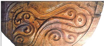
Ibn Tolun Camii avlu revak kemerleri içindeki bezeme

Tolunoğulları dönemine ait oyma ağaç işçiliği örneği (Louvre Museum - Paris)