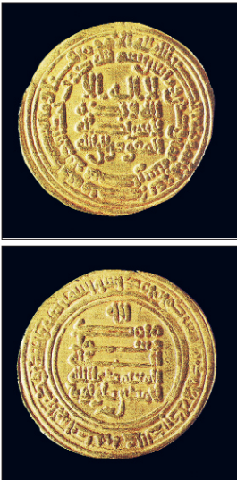
Ahmed b. Tolun adına (yanında Abbâsî Halifesi Mu'temid-Alellah'ın adı vardır) basılmış dinar (Yapı ve Kredi Bankası Koleksiyonu, nr. 16272)

Humâreveyh'ten sonra kumandanlar arasında çıkan rekabet yüzünden ordu bölündü, hânedan mensupları birbirine düştü ve saltanat mücadelesi başladı. Yetkileri ellerine geçiren kumandanlar, Ahmed b. Tolun'un oğulları hayatta iken Humâreveyh'in henüz on dört yaşındaki oğlu Ebû'l-Asâkir Ceş'i tahta çıkardıklarından ülkede önemli karışıklıklar meydana geldi ve Tolunoğulları yıkılış sürecine girdi, isyan ve karışıklıklar birbirini izledi. Genç sultan kumandanların tahrikiyle amcalarını tutuklattı; kendini içki, oyun ve eğlenceye verdi. İçki meclislerinde bazı kumandanlara karşı ağır hakaretlerde bulundu ve onları azledeceğini söyledi. Sultanı öldürmek için harekete geçen bazı kumandanlar suikast planlarının önceden öğrenilmesi üzerine kaçmak zorunda kaldılar. Altmış kişi civarında olan bu kumandanlar Mu'tazid-Billâh'ın davetiyle Bağdat'a gitti ve her birine hil'at giydirildi. Bu arada Suriye Valisi Tuğç b. Cüf bağımsızlığını ilân etti. Suriye'de kalan muhalif kumandanlar da isyan çıkardı. İsyancıların niyeti Ceş'in amcalarını hapisten çıkarıp birini sultan ilân etmekte. Ancak Ceş, tahta geçirmek istedikleri amcası Nasr'ı (veya Mudar) öldürüp cesedini onların önüne attı. Bunun üzerine âsiler saraya girerek Ceş'i tahttan indirip tutukladılar ve birkaç gün sonra öldürdüler (283/896). İsyan