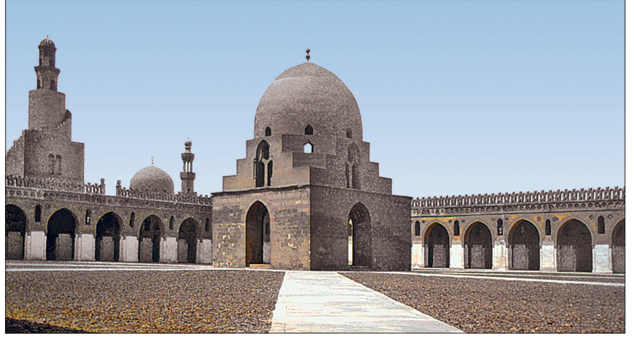
Ahmed b. Tolun tarafından inşa ettirilen İbn Tulun Camii'nin avlusundan bir görünüşü

270'te (884) vefat eden Ahmed b. Tolun'un yerine oğlu Humâreveyh geçti. Babasından istikrarlı, zengin bir ülke devra-