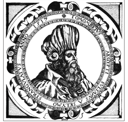
Tomanbay'ın XVII. yüzyıl başında yapılmış bir tasviri (R. Knolles, The Generall Historie of the Turkes , London 1603, s. 551)

879 (1474-75) yılında doğduğu kabul edilir. Kendisini amcası Kansu (Kansav) Gavri satın aldığı için nisbesinde "min Kansav el-Gavri" ifadesi geçer. Çerkez asıllı olan Tomanbay (Tumanbay) satın alınmasının ardından dönemin sultanı Kayıtbay'a sunuldu ve onun memlûkleri arasına girdi. Kayıtbay'ın 1496'da ölümüne kadar Kitâbiye memlûkleri arasında yer buldu. Daha sonra Kayıtbay'ın yerine geçen oğlu el-Melikü'n-Nâsir Nâsirüddin Muhammed kendisini âzat etti; önce câmedâr, ardından sultanın muhafız kıtasında haseki sıfatıyla görevlendirildi. Amcası Kansu Gavri'nin sultan olduğu 906 (1501) yılına kadar bu görevde kaldı ve onun sultanlığıyla birlikte "onlar" emirliğine yükseltildi. 910'da (1504) Kansu Gavri'nin oğlu Muhammed ölüncü sultan yeğeni tablhâne emirliğine getirdi ve oğlunun yerine eşad şarabhâne görevini verdi. 913 (1507) yılına kadar bu görevde kalan Tomanbay aynı yıl ed-devâdâr el-kebîr olan Emîr Özdemir ve-