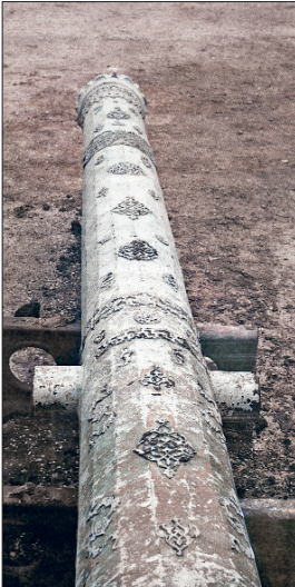
Kanûnî Sultan Süleyman adına dökülen tunc darpzen (İstanbul Askerî Müzesi, Envanter, nr. 9)