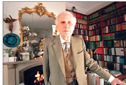
Arnold J. Toynbee

rılmak zorunda kaldı. Oxford, Cambridge, Birmingham, Birmingham (Alabama), Prin- ceton, New Jersey, Columbia ve New York üniversitelerinden fahri doktora unvanı al- dı, Fransa Enstitüsü üyeliğine seçildi. 1937'de British Academy'de öğretim üyesi ola- rak bulundu. 22 Ekim 1975'te öldü.