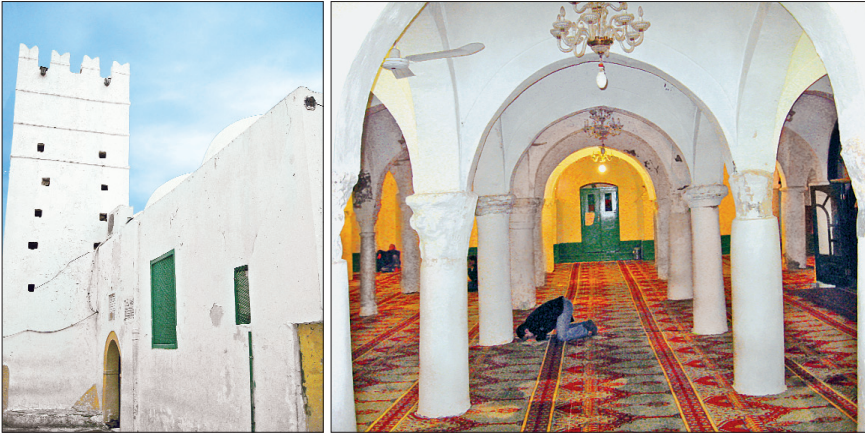
Trablusgarp'ta Nâka Camii ve içinden bir görünüşü

İtalya'ya karşı savaştı. Trablusgarp 1943 yılına kadar İtalyan işgali altında kaldı. İtalya egemenliği döneminde klasik Arap şehri görünüşündeki eski şehrin doğusunda ondan tamamen farklı modern bir şehir kuruldu. Ardından 1951'de bağımsızlık ilân edilinceye kadar İngiltere'nin kontrolüne girdi. Akdeniz sahilleri oldukça verimli olan Trablusgarp'ta ziraat da gelişmişti. Osmanlı idaresinin son dönemlerinde 6.694.000 hurma ağacı, 321.557 zeytin ağacı, 40.000 incir ağacı vardı. 1881'de Trablusgarp-İstanbul arasında telgraf hattı döşendi. Bunu 1882'de deniz altından Malta'ya kadar bir başka telgraf hattı izledi. Daha sonra vilâyet merkezinden Garyân, Fesato, Nâlût, Zâviye, Uceylât, Züvâre, Humus, Zilteyn, Mısrâte, Mıslâte, Tarhuna ve Urfella'ya telgraf hatları çekildi.