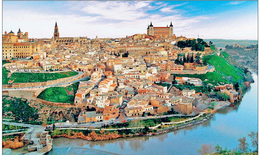
Tuleytula'dan bir görünüş

Muhammed b. Abdurrahman'ın başa geçmesinden bir süre sonra Tuleytula yeni ayaklanmalara sahne oldu. Bunlarda Müsta'ribler belirgin şekilde yer aldı. İsyânı hem León Krallığı'nın destek ve teşviklerinin hem de Kurtuba'da meydana gelen "fedailer hareketi"nin yansımalarının etkilediği muhakkaktır. Tuleytulalılar 238 (852) yılında topyekün bir ayaklanma başlattılar; Rabah Kalesi'ne (Calatrava) saldırıp içindeki Arap nüfusunun çoğunu kılıçtan geçirdiler. Emir Muhammed bizzat Tuleytula üzerine sefere çıkmak zorunda kaldı. Kurtuba'da bu sefere büyük önem verildi; âsi bir şehir üzerine değil "dârülharb"e yapılmakta olan bir sefer gibi değerlendirildi. Bu arada pek çok fakih ve zâhid orduya iştirak etti. Emir Muhammed gerçekleştirdiği seferle Tuleytula'ya Kurtuba'nın üstünlüğünü kabul ettirdiyse de 242'de (857) Tuleytulalılar yeniden ayaklandılar. Emir Muhammed bir yıl sonra tekrar Tuleytula seferine çıktı; Tuleytula-