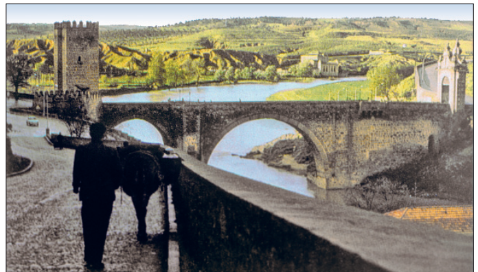
Tuleytula'da el-Kantara Köprüsü