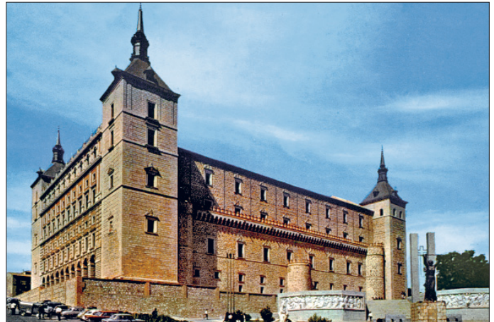
Alkazar – Tuleytula (Toledo) / İspanya

Tuleytula'da Endülüs'teki medenî ve kültürel gelişmelere vâkıf müdeccenler, müsta'ribler ve yahudilerden oluşan çoğulcu bir nüfus yapısının, ayrıca İslâmî eserler ihtiva eden kütüphanelerin varlığı, bu şehri XII ve XIII. yüzyıllarda Avrupa'nın çeşitli ülkelerinden araştırmacılar için bir merkez haline dönüştürdü. Esasen XII. yüzyılda bilimin Tuleytula'da olduğu Avrupa'nın her yanında genel bir kanaat olarak yayılmış bulunuyordu. Bunun sonucunda şehirde İslâm biliminin ürünlerini Batı dillerine nakletme amaçlı kapsamlı bir tercüme projesi uygulamaya konuldu. Fârâbî'nin İhşâ'ü'l-'ulûm 'unu kullanan Gerard de Cremona ve Dominicus Gundissalinus ile tercüme tıptan felsefeye kadar çok sayıda eseri kapsadı. Aristo felsefesi İbn Sinâ, Gazzâlî ve İbn Cebriol gibi müelliflerin Neo-Platonik eğilimleri doğrultusunda yeniden özetlendi ve yorumlandı. Tuleytula, Arap biliminin elde edilebileceği doğal mekân olarak kabul edilmekteydi. Tuleytula'ya seyahati hakkında geniş bilgi veren Morleyli Daniel ilim tahsili için önce Paris'e gitmişti. Fakat burada aradığını bulamayınca düş kırıklığına uğradı. İlimin Araplar'da olduğunu öğrenince Tuleytula'ya geçti. Johannes Hispalensis tarafından çevirilen eserlerin listesi o dönemdeki çabaların büyüklüğü hakkında bir fikir verebilir. Eskiden hıristiyan olan bu yahudi çevirmeni