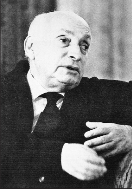
Tarık Zafer Tunaya

Doktorasını tamamladıktan sonra kadrosu Umumi Amme Hukuku Kürsüsü'ne nakledildi. 1948'de Âmme Hukukumuz Bakımından İkinci Meşrutiyet'in Fikir Cereyanları başlıklı doçentlik tezini hazırladı ve 1950'de doçent oldu. Doçentlik çalışması, Peyami Safa'nın Türk İnkılabına Bakışlar (1938) adlı kitabının ardından yaygın biçimde tartışılmaya başlanan, 1908 sonrası Osmanlı düşünce tarihi konusunda kaleme alınmış ilk kapsamlı çalışmadır. Teksir halinde az sayıda kopyası yapılan eser basılmamış olmakla birlikte (bir kopyası İÜ Hukuk Fakültesi Kütüphanesi'ndedir [nr. T. 7]) Tunaya'nın daha sonra kaleme alacağı kitapların alt yapısını oluşturmuştur. 1952'de askerlik hizmetinin ardından kadrosu Esas Teşkilât Hukuku Kürsüsü'ne nakledildi. 1953'ten itibaren yurt dışında ve özellikle Amerika'da çeşitli araştırmalarda bulundu. 1959'da profesörlüğe yükseltildi.