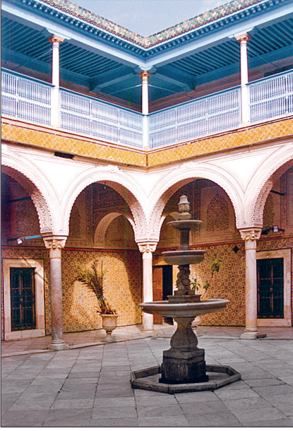
Tunus'ta eski bir evin avlusundan görünüşü

avlıların çevresinde yer alan "T" planlı mekânlarla bunların gerisindeki günlük ikameteye ayrılmış odalar, hamam ve helâ gibi bölümlere yer verilmiştir. Dayı Osman Evi (XVI. yüzyıl sonu), Ramazan Bey Evi (XVII. yüzyıl), Bin Abdullah Evi, Bayram Türkî Evi (XVI. yüzyıl sonu), Bey Evi (1610-1637) gibi sivil mimari örneklerinin hepsinde bu plan küçük farklılıklarla tekrar edilmiştir. Çeşitli dönemlerde eklenen birçok yapıdan oluşan Bardo Sarayı'nda yapılar surlarla çevrelenen geniş bir alanın içinde yer almaktadır. Cami, hamam ve askerî okul gibi yapılar bu sahanın doğusunda, saray erkânının kaldığı asıl bölüm de büyük bir külliye halinde batıda bulunmaktadır.