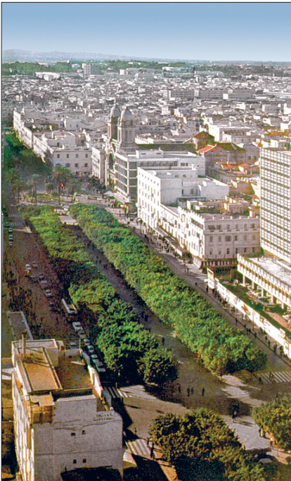
Tunus şehrinin modern kesiminden bir görünüşü