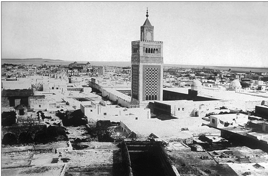
XIX. yüzyılın sonlarında Tunus şehrini ve Zeytûne Camii'ni gösteren bir fotoğraf (İÜ Ktp., Album , nr. 90598)