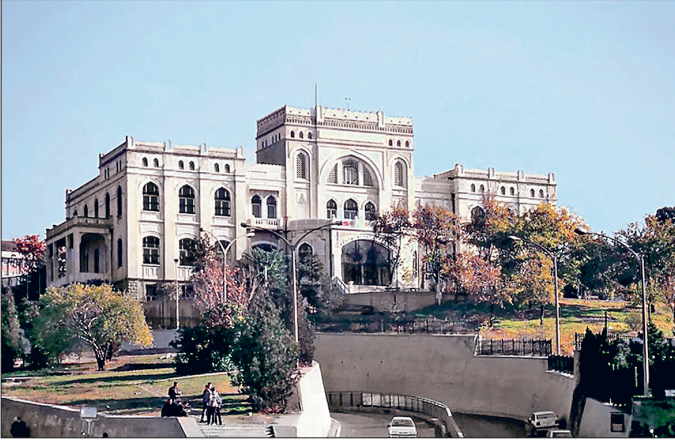
Ankara Türk Ocağı binası