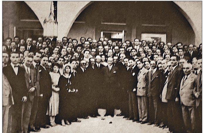
I. Türk Tarih Kongresi üyeleri Marmara Köskü'nde Atatürk ile birlikte

Türk Tarih Kurumu Arşivi gerek bağış gerekse satın alma yoluyla birçok arşiv malzemesini bünyesinde toplamıştır. Buradaki belgeler Osmanlı Devleti'nin son dönemlerini ve Türkiye Cumhuriyeti dönemini kapsamaktadır. Belgelerin yanı sıra Osmanlı ve Türkiye Cumhuriyeti dönem-