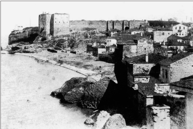
XX. yüzyılın başında Trabzon Kalesi ve Efrenciyan mahallesini gösteren fotoğraf

Trabzon Osmanlı idaresine girdikten sonra hızla bir Türk-İslâm şehri haline dönüştü. Kale surları tamir edildi, kiliselerin bir bölümü camiye çevrildi, halkın bir kısmı başka bölgelere sürüldü, yerlerine Türkler yerleştirilmeye başlandı. Trabzon'un önemi dolayısıyla burada hânedana mensup şehzadeler idarecilik görevi yaptı. II. Bayezid'in oğulları Abdullah ve ardından Selim sancak beyi olarak Trabzon'da bulundu. Özellikle Selim yirmi dört yıl kadar burayı yönetti, oğlu Süleyman Trabzon'da doğdu. Selim, idareciliği sırasında Osmanlı nüfuzunu Gürcistan'a doğru yaydığı gibi Safevîler'le de mücadele etti. Çaldıran seferinde Trabzon bölgede önemli bir askerî üs konumuna geldi. Özellikle XVI. yüzyılın sonlarından başlayıp 1639'a kadar devam edecek olan Osmanlı-Safevî mücadelesinde Trabzon büyük bir askerî ikmal merkezi oldu. Bu durumunu XVIII. yüzyılda da sürdürdü. Osmanlı idaresinde Trabzon'da bazı küçük hadiseler dışında önemli bir olay meydana gelmedi. XVIII. yüzyılda giderek güçlenen âyanlar bazı karışıklıklara yol açtı. Bunlardan bir kısmı devletin desteğiyle güçlendi ve Trabzon'a vali tayin edildi. Bilhassa Canikli sülâlesi mahallî derebeyleri bertaraf ederek kuvvet ve nüfuz kazandı. Canikli Ali Paşa, Trabzon valiliği sırasında bazı önemli askerî hare-