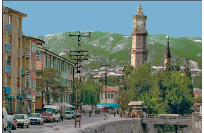
Tokat'tan bir görünüş

1600'lü yılların başında Tokat, Rum eyaletinin hazine defterdarlığının merkezi yapıldı. 1659'da Rum Hazine Defterdarlığı'nın kaldırılarak bu defterdarlığa bağlı muhâtaaların bir voyvodaya iltizama verilmesi üzerine bu defa Rum eyaleti muhâtaalarını üstlenen voyvodaların malî idare merkezi oldu. Bu durum muhassıllık idaresinin kurulduğu 1840 yılına kadar devam etti. 1840 başında Tokat kazası ile birlikte Artukâbâd, Kazâbâd, İpsile-Şarkîpâre kazaları bir muhassıllık kabul edildi. 1842 yılına girildiğinde olumsuz sonuçları görülen muhassıllık uygulamasına ülke genelinde son verilince eyaletlerde kazaların yönetimi müdür adı verilen ve kaza ileri gelenleri arasından seçilen yöneticilere bırakıldı. Bu yeni idarî değişiklikle birlikte Tokat kazası da bir müdür tarafından idare edilmeye başlandı. 1842-1843 yıllarında Mehmed Ağa Tokat'ta müdür olarak görev yapıyordu. 1842-1860 arasında Tokat kazası merkez, Komanat ve Kafirni nahiyelerinden meydana gelmekteydi. 1864 yılı Vilâyet Nizamnâmesi ile Tokat kazası, Sivas vilâyetine bağlandı. Bu defa kaza müdürü yerine kaymakam görevlendirildiğinden Tokat kazası bir kaymakamın başkanlığında kaza idare meclisi tarafından idare edilmeye başlandı. Kaza merkezi olarak Tokat şehrinde 1870'te belediye teşkilâtı kuruldu. Belediye meclisi bir başkan, beş