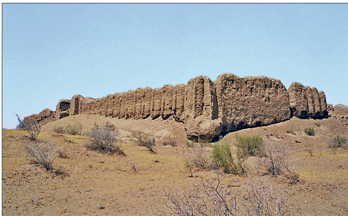
Eski Merv ile Âmül arasında yer alan Akçakale Kervansarayı'nın kalıntıları

Seyhun (Siriderya) boylarında oturan Oğuzlar arasında X. yüzyıldan itibaren İslâmîyet'in yayılması sonucu ortaya çıkan Türkmen tanımlaması, Mâverâünnehirli yerli müslümanlar tarafından İslâmîyet'e giren Oğuzlar için gayri müslim Oğuzlar'dan ayırt edilmek üzere kullanılmıştır. Türkmen adının yerlilerce "müslüman Türk" anlamında yaygınlaşması bu addaki topluluğun İslâmîyet'i kabul eden ilk Türk kavmi olmasıyla ilgilidir. Türkmen kelimesinin nereden geldiği konusunda başlıca iki görüş vardır. Bunlardan birine göre Türkmen, Türk adı ile Farsça "mân"dan (mânend) gelmiş olup "Türk'e benzer" demektir. Bîrûnî bu fikirde olduğu gibi Kâşgarlı Mahmud da Türkmen adının bu şekilde açıklanmasıyla ilgili bir hikâye anlatır. İkinci