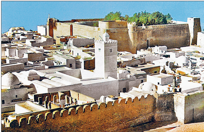
Hamamet'ten bir görünüş