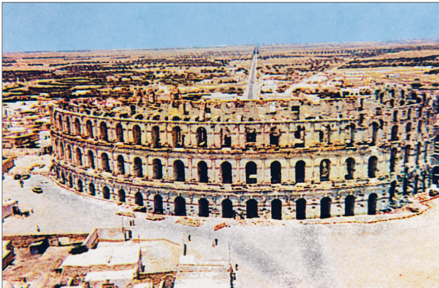
el-Cem'de Roma dönemine ait Colloseum

Tunus'ta ortaya konan mimari, süsleme ve el sanatlarında Endülüs-Mağrib sanatının etkisi çok açık biçimde görülmektedir. Osmanlı döneminin ilk yıllarında bu gelenek bütün ilkeleriyle devam etti, Türk sanatına ait özellikler ancak XVII. yüzyıldan itibaren ortaya çıkmaya başladı. 300 yılı aşkın bir süre Türk idaresinde kalan Tunus camii, medrese, imaret, saray, han, hamam, çarşı, kışla ve kale gibi mimari eserlerle donatıldı. Külliye inşasına Tunus'ta fazla ilgi gösterilmedi. Türbenin çevresindeki yapılardan oluşan Sıdî Sâhib Külliyesi'yle (XIV ve XVII. yüzyıl) cami çevresinde inşa edilen Cedîd Külliyesi (1726-1727) ve Yûsuf Sâhibü't-tâba' Külliyesi (1813-1814) Anadolu ve İstanbul'da yapılan pek çok külliye uygulanan bir dü-