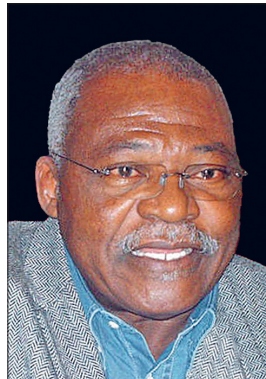
Togo'nun ilk müslüman devlet başkanı el-Hâc Abbas Bonfoh

1961 seçimlerinden sonra başkanlık sistemine geçildi ve Sylvanus Olympio ülkenin ilk başkanı seçildi. Fakat 13 Ocak 1963 tarihinde bir askerî darbeyle öldürüldü. Bağımsızlık sonrası ülkenin ilk başbakanı olan ve Fransa tarafından desteklenen Nicolas Grunitzky seçimleri kazanıp devlet başkanlığını elde etti. Aynı yıl yürürlüğe giren anayasa ile yeni bir meclis kuruldu. Ancak 1967 yılında Genelkurmay Başkanı Etienne Gnassingbé Eyadéma askerî darbeyle yönetime hâkim oldu ve siyasi partileri kapattı. 1979'da hazırlanan yeni bir anayasa ile ülkede tek partili sisteme geçildi. Yapılan ilk seçimde Eyadéma devlet başkanı seçildi. 1986'daki seçimleri de kazandı; 1990 yılında muhalefetin yönlendirdiği gösteriler karşısında muhalefetten Joseph Koku Koffigoh'u başbakan tayin etmek zorunda kaldı. 1992'de yeni anayasa düzenlenerek gergin ortam yumuşatılmak istendi. Eyadéma muhalefetin boykot ettiği 1993 seçiminde üçüncü defa devlet başkanlığına getirildi. 1998 ve 2003 yıllarındaki seçimleri de kazanan Eyadéma'nın başkanlık görevi 2005 yılında ölümüne kadar devam etti. Yerine bir oğulluğuyla E. Gnassingbé'nin geçmesi üzerine muhalefet ve Afrika Birliği buna karşı çıkınca başlayan karışıklıklar yüzünden istifa etmek zorunda kaldı. Yerine geçici olarak müslüman meclis başkanı el-Hâc Abbas Bonfoh getirildi. 25 Nisan 2005 tarihindeki seçimleri tartışmalı bir şekilde Gnassingbé'nin kazanması üzerine ülkede büyük karışıklıklar çıktı ve resmî rakam-