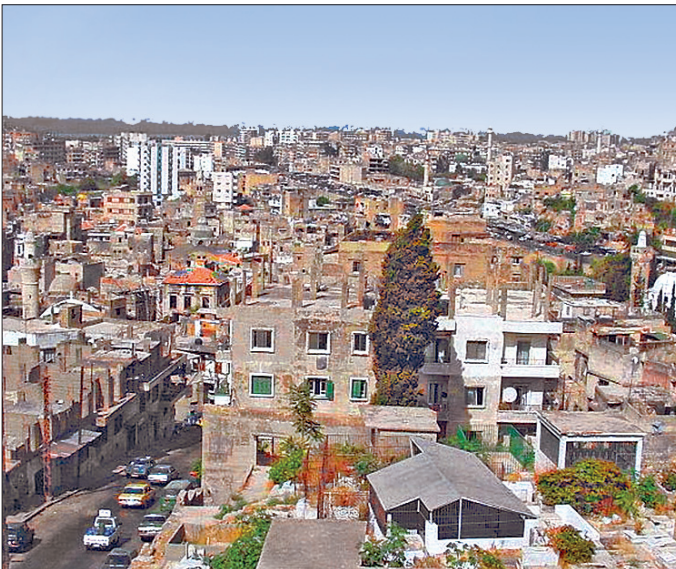
Trablusşam'dan bir görünüş

Önemli bir ticaret merkezi olan Trablusşam IX. (XV.) yüzyılda Avrupa ticaretine açık olma özelliğini sürdürüyordu. Bilhassa Fransa ve Cenova ile sıkı ticarî ilişkileri vardı. 1366 ve 1367'de Kıbrıs Latin Krallığı donanmasının hücumuna mâruz kaldı. Şehir bu dönemde parlak bir tica-