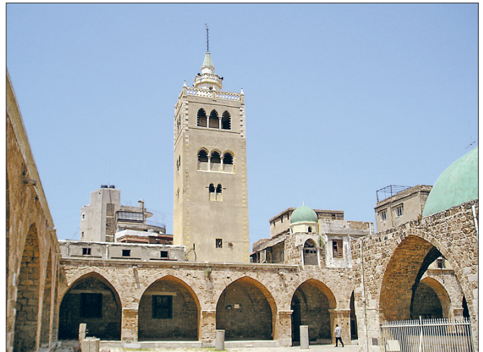
Trablusşam'da Câmiü'l- Mansûrî'nin avlu ve minaresi

XVII. yüzyılda Trablus Limanı daha da gelişti; 1000 gemi alacak kapasitedeki bu liman yanında Kalavun'un inşa ettirdiği kule 1521'de Kanûnî Sultan Süleyman tarafından tamir ettirilmişti. Evliya Çelebi biraz abartılı olarak limanın 1000 kalyon ve 1000 firkate ile kadirge alacak büyüklükte olduğundan bahseder. Fakat liman aslında batı ve kuzey (yıldız) rüzgârlarına açık bulunduğundan gemiler için çok da