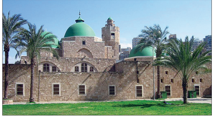
Câmîu Taynâl – Trablusşam