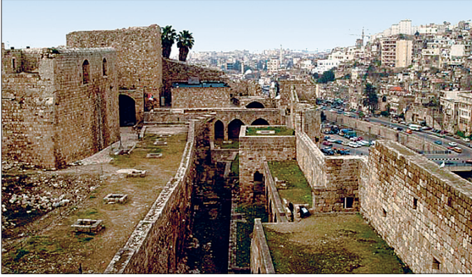
Trablusşam Kalesi'nden bir görünüş

ret merkezi haline geldi ve Doğu Akdeniz'de ticaret gemilerinin başlıca uğrak yeri durumundaydı. İhraç maddeleri içinde ipekli kumaşlar önemli bir yere sahipti. Akdeniz ticaretiyle uğraşan devletlerin burada birer temsilcileri bulunuyordu. Trablusşam, Memlükler döneminde önemli imar faaliyetlerine sahne oldu; şehirde dokuz cami, on altı medrese, beş han, üç hamam ve bir çarşı inşa edildi. Bunlardan el-Câmiu'l-Mansûrî / el-Câmiu'l-kebir (693/1294), Câmiu Taynâl / Taylân (736/1336), Câmiu'l-Attâr, Câmiu't-tevbe, Câmiu'l-Bertâsi ile Tedmüriyye, Şemsiyye, Nûriyye ve Karatâviyye medreseleri anılabilir.