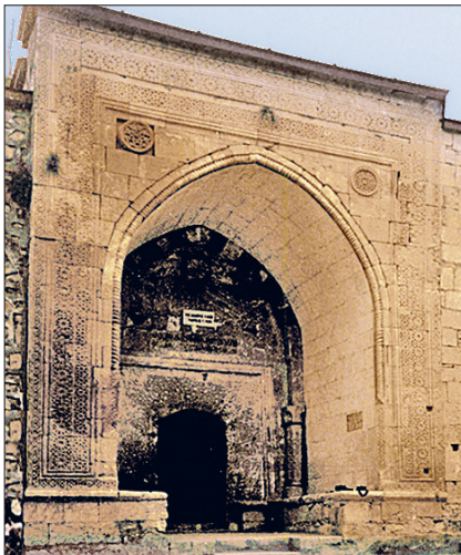
Yelmâniye Camii'nin taçkapısı