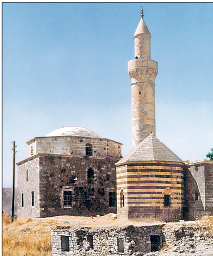
Pertek'te Sağman Camii ve Türbesi – Tunceli

Tunceli'nin içinden geçen ve Erzurum'u Malatya'ya bağlayan başlıca ulaşım eksenini Munzur çayına (Munzur Köprüsü'nü geçtikten sonra) paralel uzanır. Şehir dar bir vadide yerleştiğinden söz konusu cadde dışında geniş bir caddeye rastlamak mümkün değildir. Topografyanın özel durumu sebebiyle mahallelere yönelen yollar inişli yokuşludur. Bir memur şehri olarak kurulan Tunceli'de bu özellik, memur lojmanlarının kamu dışında çalışanlara ait meskenlerden daha fazla oluşuyla dikkati çeker. Şehirde sanayi gelişmemiştir. Çevresindeki turistik yerler (Munzur vadisi, Munzur dağları) ziyarete açıldığı takdirde Tunceli şehri buraları görmeye gelenler için bir turistik merkez niteliğini kazanabilir. Tunceli şehrinin merkez olduğu Tunceli ili Bingöl, Elazığ ve Erzincan illeriyle çevrilmiştir. Merkez ilçeden başka Çemişgezek, Hozat, Mazgirt, Nazımiye, Ovacık, Pertek ve Pülümür adlı yedi ilçeye ayrılır. 7432 km 2 genişliğindeki Tunceli ilinin sınırları içinde, 2010 yılı verilerine göre 76.699 kişi yaşıyordu, nüfus yoğunluğu on idi. Diyanet İşleri Başkanlığı'na ait 2007 yılı istatistiklerine göre Tunceli'de il ve ilçe merkezlerinde yirmi, kasabalarda bir ve köylerde seksen üç olmak üzere toplam 104 cami bulunmaktadır. İl merkezindeki cami sayısı üçtür.