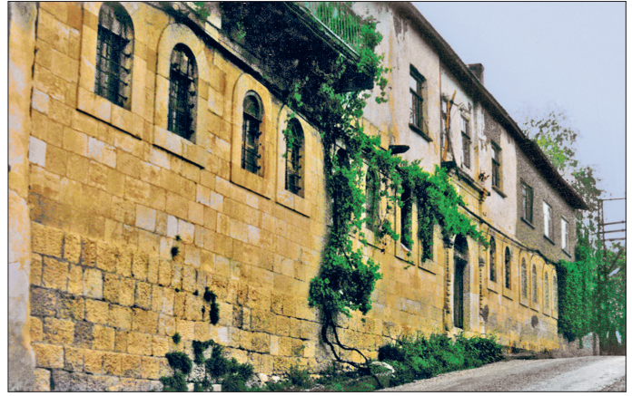
Hamidiye Medresesi - Çemişgezek / Tunceli

Pertek Sağman Camii (1565-1570) kare planlı harim ve kuzey cephesinde üç gözlü son cemaat yerinden oluşmaktadır. Son cemaat yerinin sağlı sollu iki yanında eyvan ve hücreler mevcuttur. Harimin batısında sekizgen gövdeli, piramidal külâhlı türbe bulunmaktadır. Cami ve türbe kesme taş malzemeyle inşa edilmiştir. Pertek Çelebi Ali Camii (1569-1570) kare planlı, tek kubbeli harimle kuzey cephesinde yanları kapalı üç gözlü son cemaat yeri, batısında kuzey-güney doğrultusunda uzanan eyvan biçimli ek mekân ve bunun ku-