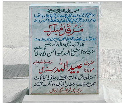
Ubeydullah es-Sindî'nin mezar taşı kitabesi