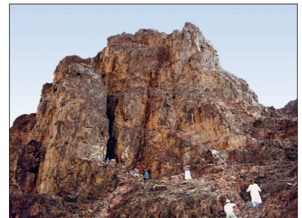
Uhud Gazvesi'nde Hz. Peygamber'in bir ara sığındığı kaya aralığı

Uhud Gazvesi'nde müslümanlar yetmiş şehid vermiş, Hanzale b. Ebû Âmir dışındaki şehidlerin hepsine işkence yapılmış, organları kesilmiştir. Müşrikleri destekleyen Hanzale'nin babası Ebû Âmir oğlunun cesedine işkence yapılmasına engel olmuştur. Vahşi, Hz. Hamza'nın ciğerini sökerek Bedir Gazvesi'nde babası, amcası ve kardeşi öldürülen Ebû Süfyân'ın karısı Hind'e götürmüş, Hind ciğerden bir parçayı ağzına alarak çiğnemiş, Vahşi'ye de mükâfat olarak ziyet eşyalarını vermiştir. Resûl-i Ekrem amcası Hamza'nın ciğerinin çıkarıldığını, burnunun ve kulaklarının kesildiğini görünce çok üzülmüş, halası Safiyye kardeşi Hamza'nın şehid edildiğini duyunca savaş alanına gelmiş, büyük bir üzüntü içinde dua ve istîğfarda bulunmuştur. Şehidler ikişer üçer kişi olarak aynı kabirde kefensiz ve üzerlerindeki elbiselerle birlikte defnedildi. Bazı müslümanlar Uhud'da şehid olan yakınlarının naasını Medine'ye götürmüş, bunu duyan Resûlullah şehidlerin öldürüldükleri yerde gömülmesi emrini verince cenazeleri tekrar savaş meydanına getirip burada defnetmiştir (İbn Hişâm, III, 102-103). Hz. Peygamber, Uhud şehidlerinin defninden sonra sahâbilerle birlikte Medine'ye döndü