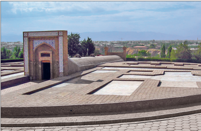
Uluğ Bey'in Semerkant'ta yaptırdığı rasathâne

Üstün bir zekâya sahip olan Uluğ Bey başarılı bir matematikçi ve astronomdu. Henüz küçük denecek yaşta Merâga Rasathânesi'ni görmüş ve zihninde ona bir yer ayırmıştı. Bu sebeple Merâga'dan sonra en büyük rasathâneyi Semerkant'ta kurmuştur. Bu yapı, Kadızâde-i Rûmî ile Cemşid el-Kâşî'nin gözetiminde inşa edilmekteydi. Ancak bu iki âlim rasathâne tamamlanmadan vefat etmiş, onların yerine Ali Kuşçu getirilmiştir. Uluğ Bey'in ölümüne kadar otuz yıl faaliyetini sürdüren rasathâne ve burada oluşturulan astronomi tabloları teleskopun icadına kadar ilim dünyasında etkili olmuştur (bk. SEMERKANT RASATHÂNESİ). Uluğ Bey, kullandığı Zic-i İlhanî 'de gördüğü bazı ölçüm hatalarını ve eksiklikleri gidermek için hem İslâm dünyasında hem Avrupa'da alanında kaynak eser kabul edilen Zic-i Uluğ Bey 'i meydana getirmiştir. Ayrıca onun geometri alanında ve özellikle üçgenler konusunda araştırmalar yaparak tanjant ve