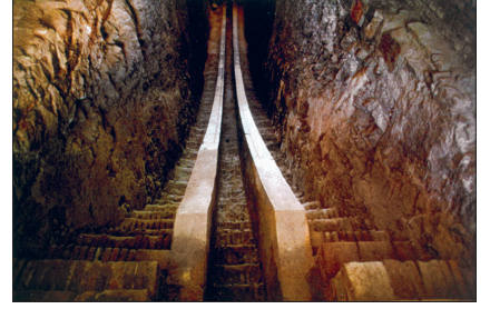
Uluğ Bey'in Semerkant'taki rasathânesinin içinden bir görünüş

Uluğ Bey matematikçi, astronom, edip ve şair olmasının yanı sıra Kur'an-ı Kerim'i yedi kıraat üzere okuyacak kadar kıraat ilmine vâkıftı. Döneminin her alanda başarılı din, ilim, sanat ve edebiyat âlimlerini davet ederek bol ihsanlarda bulunmuş, kendisi de onlardan çok istifade etmiştir. Kadızâde-i Rûmî, Cemşid el-Kâşî ve Ali Kuşçu bunların en meşhurlarıdır. Uluğ Bey'in saray şairleri arasında İsmet-i Buhârî ile Çağatay şiirinin ilk önemli şairi Sekkâkî'nin özel bir yeri vardı. Sekkâkî, Uluğ Bey için yazdığı kasidede, "Felek ne kadar dönerse dönsün / Ne senin gibi âlim bir hükümdar ne de benim gibi bir Türk şairi gelecektir" diyerek hem onu hem kendini övmüştür. Matematik ve astronomi alanındaki üstün başarılarının yanında Uluğ Bey'in mimaride bıraktığı eşsiz eserlerin bir kısmı zamanımıza ulaşmıştır. 1417-1420 yılları arasında biri Buhara'da, diğeri Semerkant'ta iki medrese yaptırmış ve geniş vakıflarla bunları desteklemiştir. Ayrıca Semerkant'ın Registan'ında bugüne kadar gelmeyen bir hankah, bir hamam ve geniş bahçeler içinde iki sa-