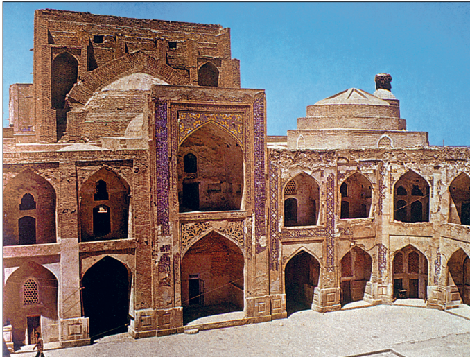
Uluğ Bey Medresesi'nin avlusu ve çift katlı revakları

Dini ilimlerle birlikte diğer ilimlerin de okutulduğu medrese bu faaliyetini uzun bir müddet sürdürmüş, XVIII. yüzyılda depo olarak kullanılan yapı daha sonra tekrar medreseye çevrilmiştir. XX. yüzyılın başlarında büyük ölçüde tahribata uğramış, 1930 yılından başlayarak tamir ve restorasyona tâbi tutulmuş, özellikle 1950 yıllarında canlılık gösteren bu faaliyet son zamanlara kadar sürmüştür. Çalışmalar esnasında sadece harap olan kısımlar değil binanın zengin mimari tezyinatı da restore edilmiştir. 56 × 81 m. ebadında olup tipik bir dört eyvanlı medrese planına sahip yapının köşelerinde yüksek minareler bulunmaktadır. Sivri kemerli devâsâ cümle kapısından geçilerek avluya açılan eyvandan başka bu eyvanın iki tarafında yer alan ve dik açılı birer dirsek teşkil eden koridorlarla avluya ulaşılmaktadır. Bina'nın meydana bakan köşelerinde bir kenarı 30 m. uzunluğunda, kare planlı ve üzerleri kubbeye örtülü iki dersane vardır. Bu dersaneler ayrıca doğrudan dışarıya açılan kapılarla da meydanla bağlantılıdır. Avluya bakan giriş eyvanının tam karşısında yer alan kible eyvanının arkasın-