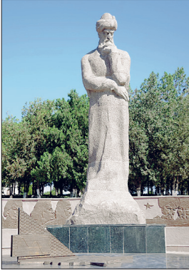
Uluğ Bey'in Semerkant'taki heykeli

babasına karşı bir ordu hazırlayarak Ceyhun kenarında onunla birkaç defa çarpıştıysa da yenildi. Bu olaydan sonra Semerkant'a dönerken oğlunun kendisini takip ettiğini öğrenen Uluğ Bey tekrar Abdülatif'in üzerine yürüdü, fakat bu defa yenilerek geri çekilmek zorunda kaldı. Bu sırada yanında yetişen Ebû Said Mirza Han Semerkant'a saldırdı. Abdülatif ise Tirmiz ve Keş'i ele geçirip Semerkant'a yürüdü ve 853 Şâbanında (Eylül-Ekim 1449) Uluğ Bey'i Semerkant'ın dış bölgesi Dimaşk'ta mağlûp etti. Uluğ Bey şehre dönmek istediye de kendi kumandanı kale kapılarını kapattırarak onu içeri almadı. Nihayet Abdülatif'e teslim olmak zorunda kaldı. İran asıllı ve Abdülatif yanlısı Abbas adlı bir kişinin başkanlığında kurulan mahkeme kendisini ve Abdülaziz'i şeriate muhalefetten idama mahkûm etti. Uluğ Bey, hükümdarlık hak ve iddiasından vazgeçip oğlunun egemenliği altında yaşamaya razı oldu ve Abdülatif'ten hacca gitmek için izin istedi. Verilen izin üzerine Semerkant'tan ayrılıysa da kumandanlar, bu durumun sakıncalı olduğu hususunda Abdülatif'i ikna ederek Semerkant'a bir iki günlük mesafede onu öldürdüler. İki gün sonra da yine bir suikast sonucu Abdülaziz öldürüldü. Devletşah Uluğ Bey'in ölüm ta-