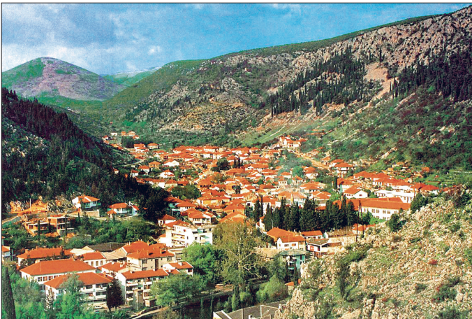
Ustulçe'den bir görünüş

II. Dünya Savaşı'ndan hemen sonra Ustulçe'nin 2320 sakini vardı. 1948-1991 yılları arasında yeni endüstri tesislerinin kurulmasıyla nüfus iki katına çıktı. Bununla birlikte kırsal nüfus durgunlaştı ya da bölgedeki Mostar, Bileća, Trebinje gibi şehirlere yönelen göçten dolayı azaldı. 1991-1995 Bosna savaşı yıllarında Ustulçe büyük zarar gördü. 1991'de 5530 kişilik nüfusu vardı, bunun % 62'si müslüman, % 20'si Sırp, % 12'si Hırvat'tı. 1993 yazının başında Hırvat ordusu Ustulçe'yi sürpriz