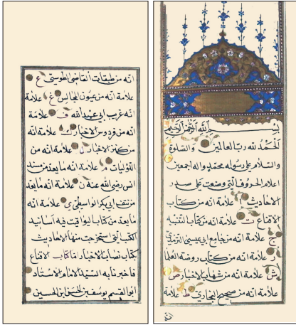
Üşî'nin Ğurerü'l-ahbâr ve dürerü'l-es'âr adlı eserinin ilk iki sayfası (Süleymaniye Ktp., Lâleli, nr. 1509)

yazılan bir şerhtir (a.g.e., II, 1868). Kaynaklarda Üşî'ye Şevâkıbü'l-ahbâr (a.g.e., I, 526) ve Nürü's-sırâc (Brockelmann, GAL Suppl. , I, 765) adlı kitaplar da nisbet edilmektedir. İsmâil Paşa'nın ona ait eserler arasında zikrettiği Yevâkitü'l-ahbâr ( Hediyyetü'l-ârifin , I, 700), Üşî'nin Nişâbü'l-ahbâr 'ının kaynaklarından olup Ahmed b. Abdullah es-Serahsî'ye aittir (Toprak, DÜİFD , sy. 23 [2006], s. 83).