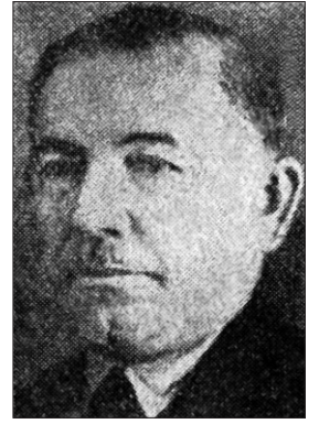
İsmail Kâzım Uz

İstanbul Fatih'te Draman semtinde doğdu. Doğum yılı pek çok eserde 1872 olarak kaydedilmişse de Başbakanlık Arşivi'ndeki belgede 1873 yılı bulunmaktadır.